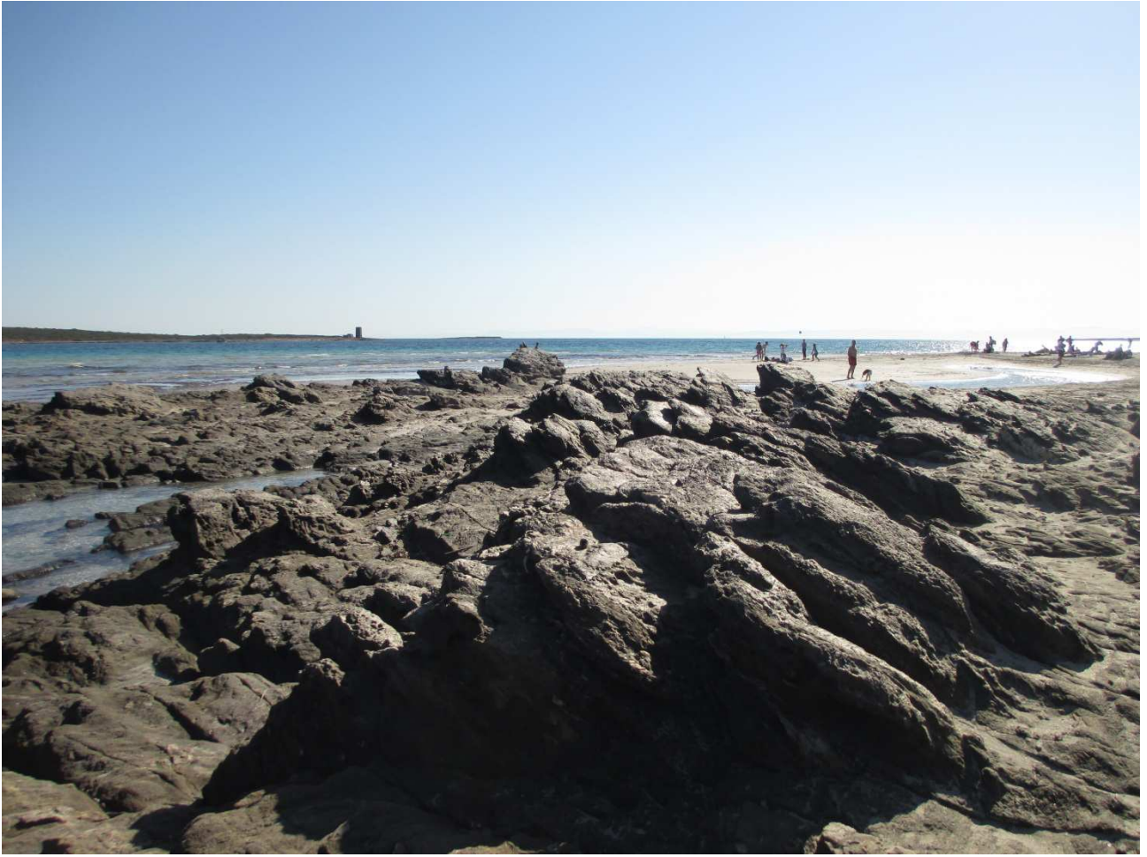
03/10/2015 Stintino ..... la pelosa e i suoi colori