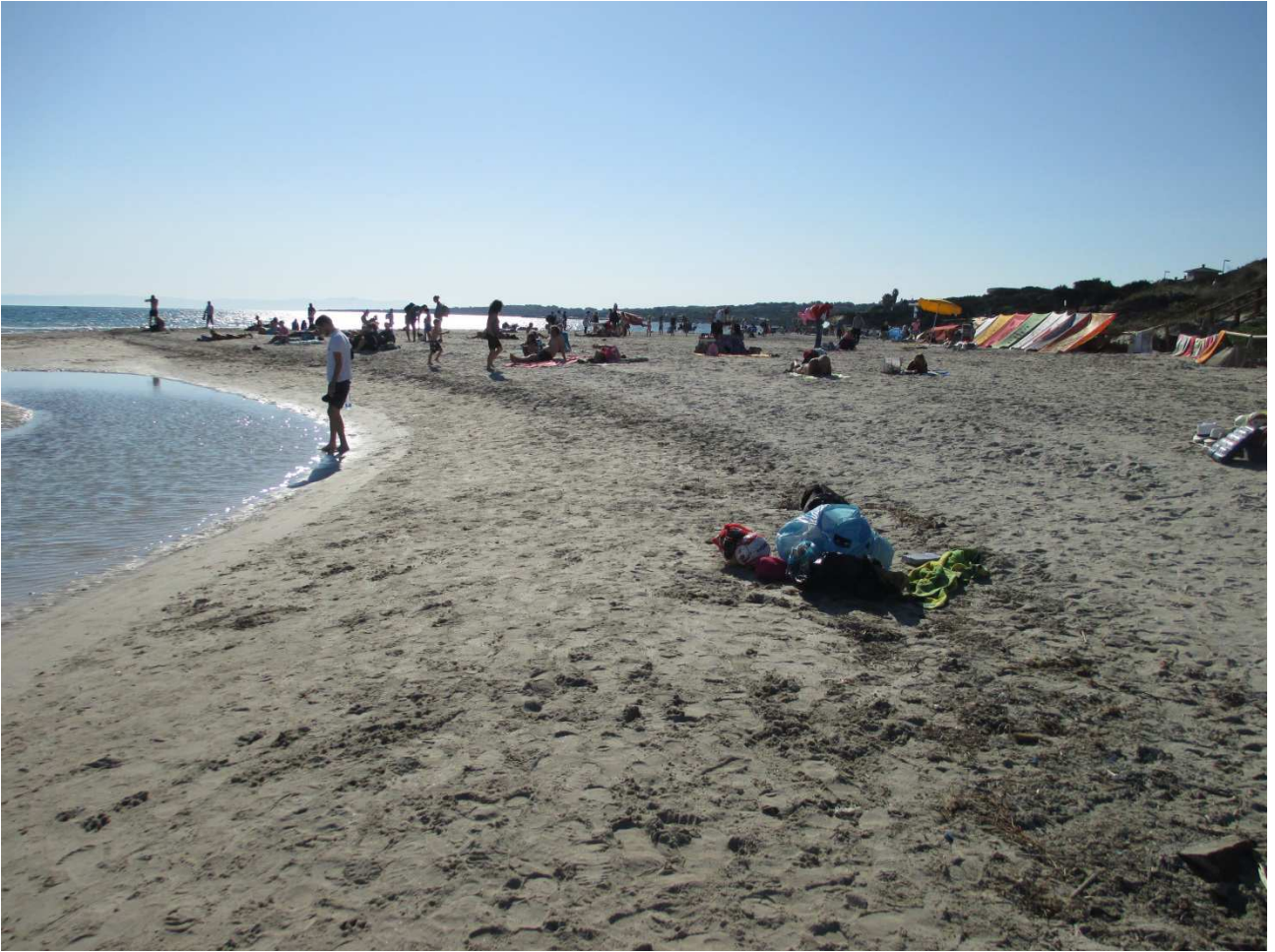
03/10/2015 Stintino ..... la pelosa e i suoi bagnanti