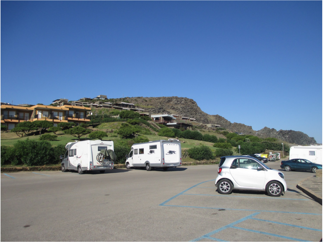
03/10/2015 Stintino ..... la pelosa Parcheggio