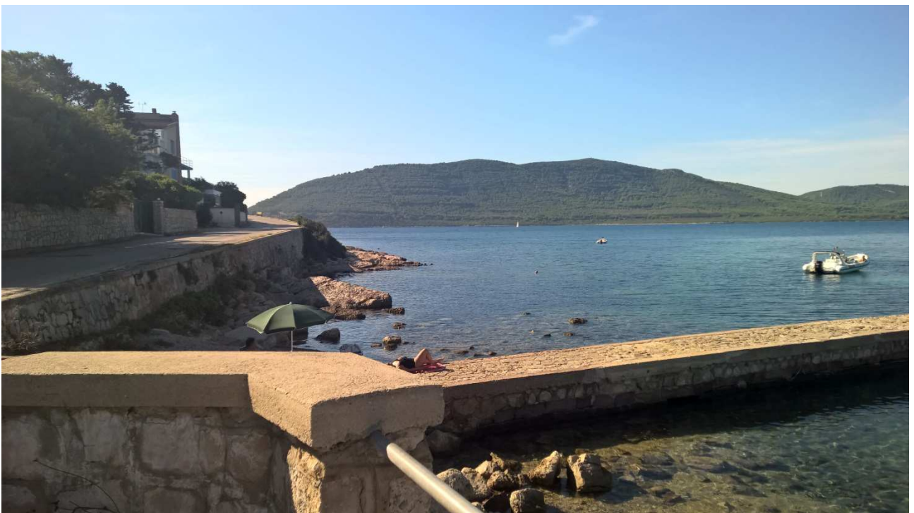
03/10/2015 Stintino ..... con sullo sfondo l'Asinara