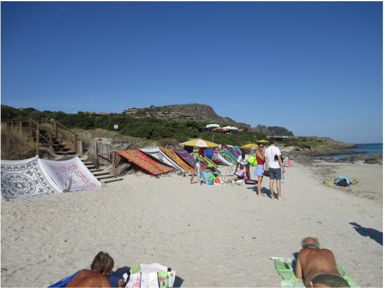
03/10/2015 Stintino ..... la pelosa e i suoi bagnanti