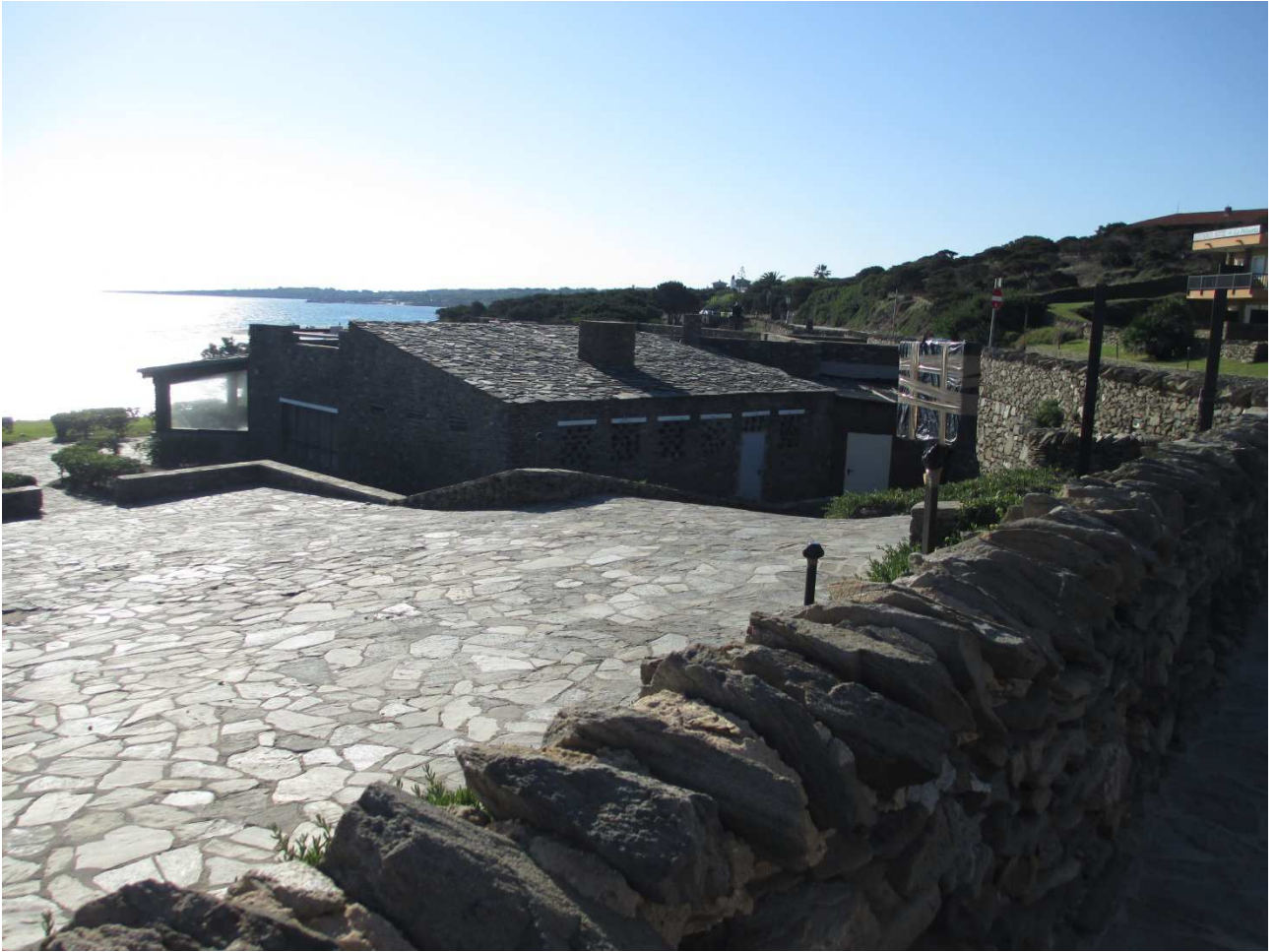
03/10/2015 Stintino ..... la pelosa e i suoi colori