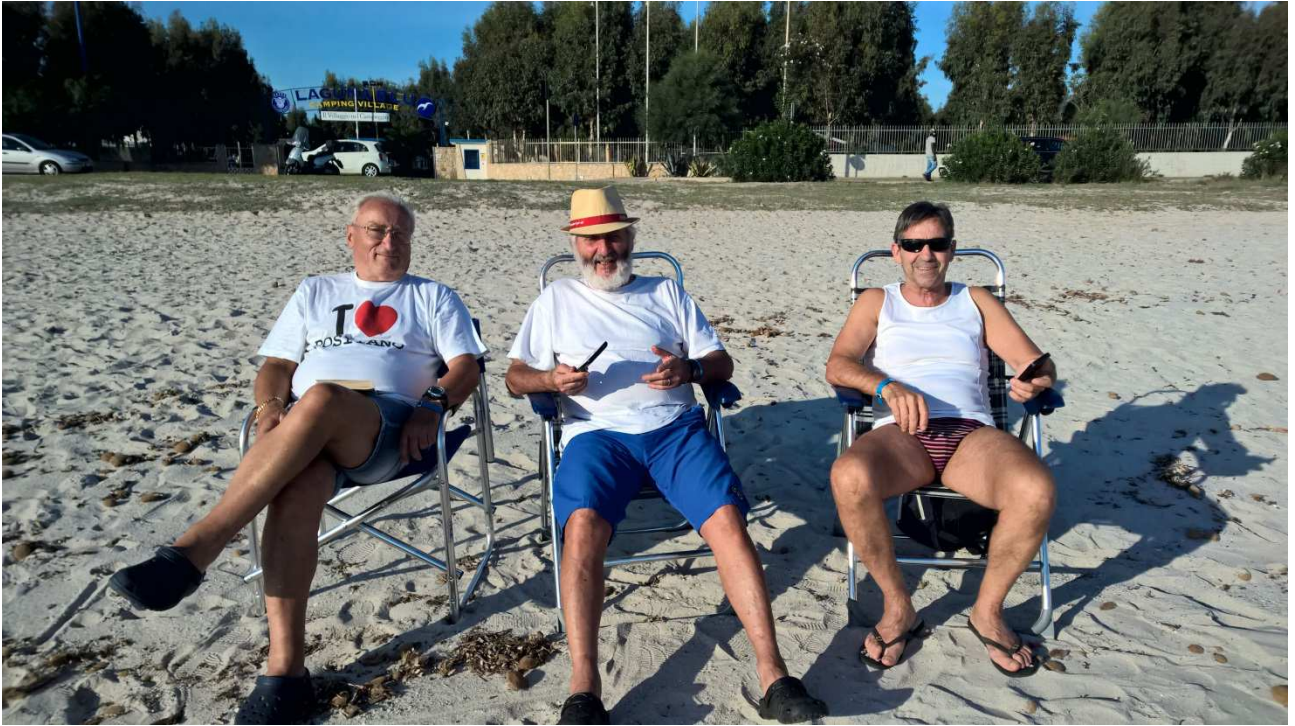
03/10/2015 Fertia S Sulla spiaggia del campeggio "Laguna blu"