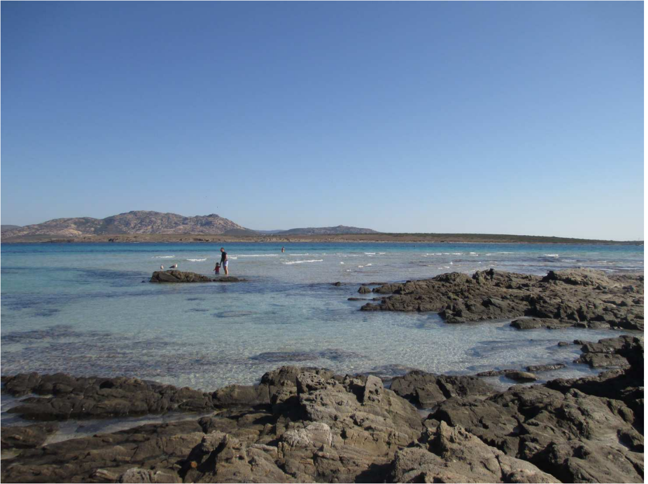
03/10/2015 Stintino ..... la pelosa e i suoi colori