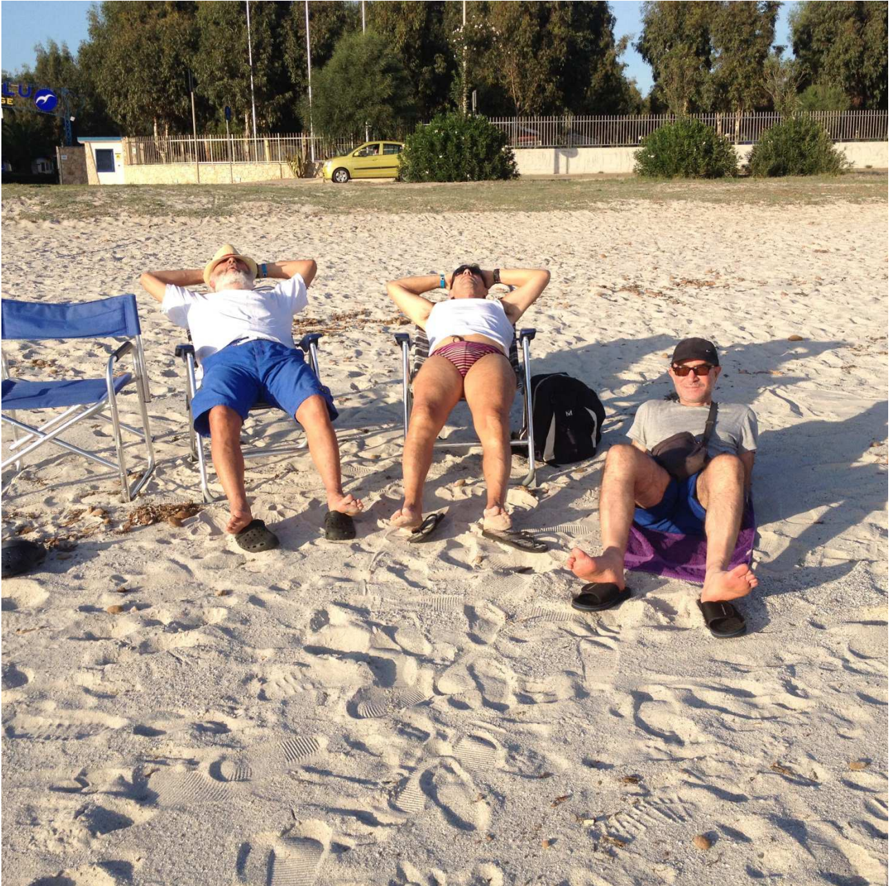
03/10/2015 Fertia S Sulla spiaggia del campeggio "Laguna blu" (questa è vita !!!!!!!!!!!!!!!)