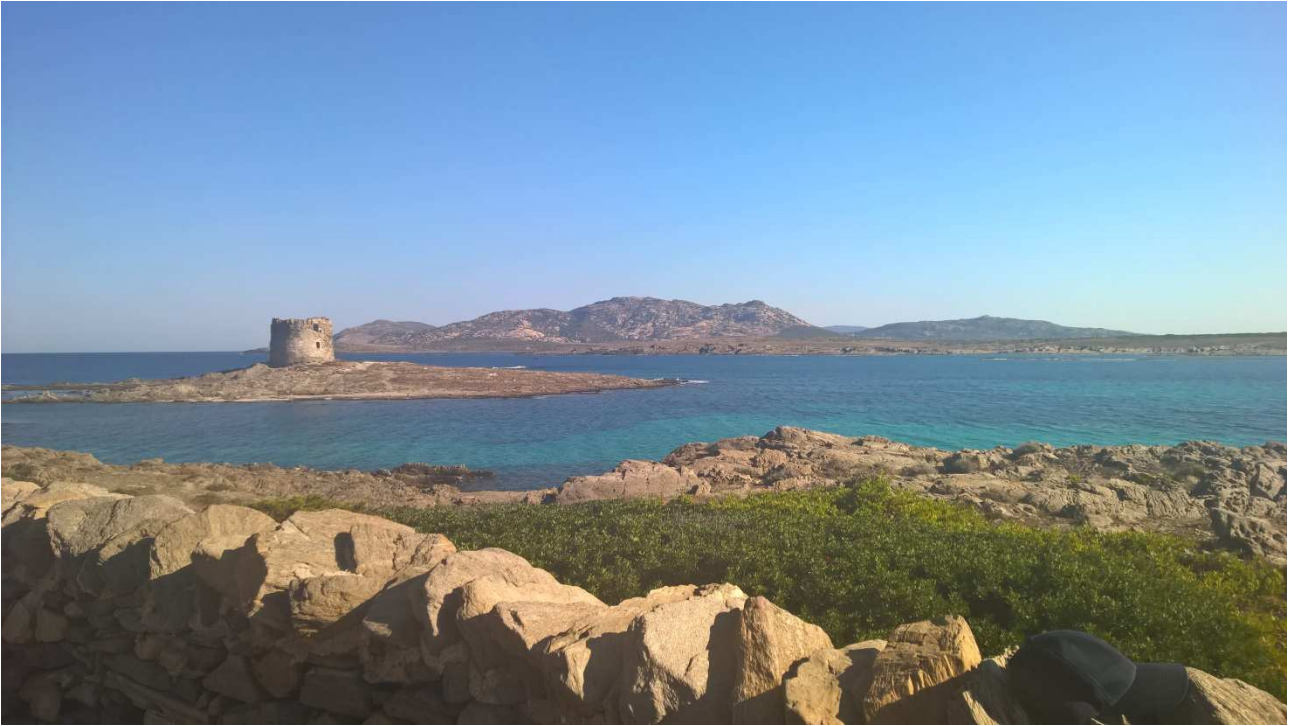
03/10/2015 Stintino ..... la pelosa e i suoi colori