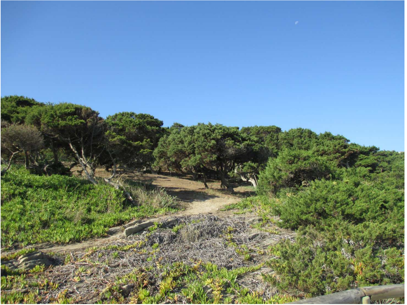
03/10/2015 Stintino ..... la pelosa e i suoi colori