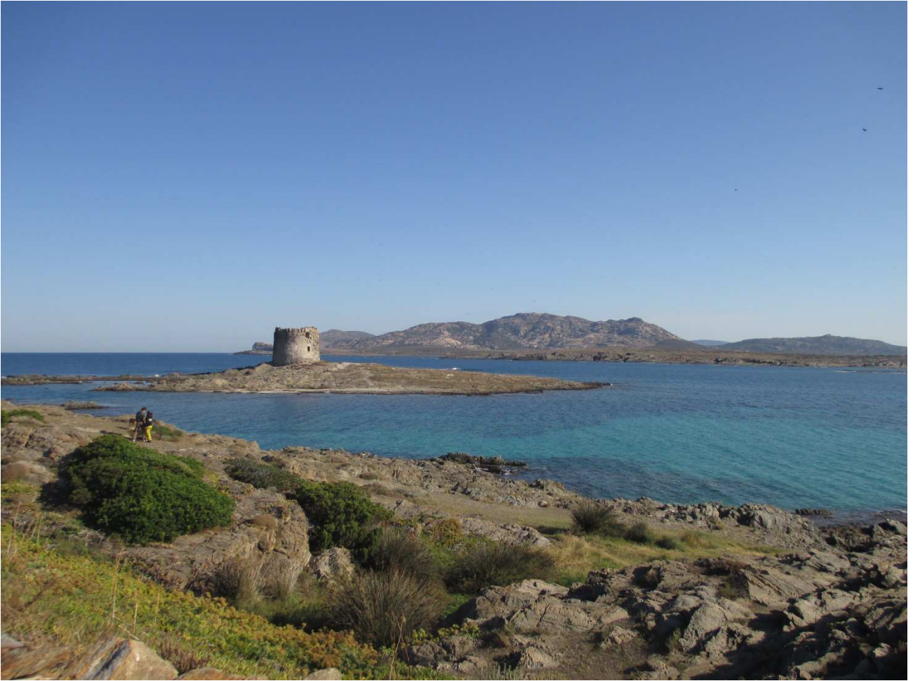
03/10/2015 Stintino ..... la pelosa e i suoi colori