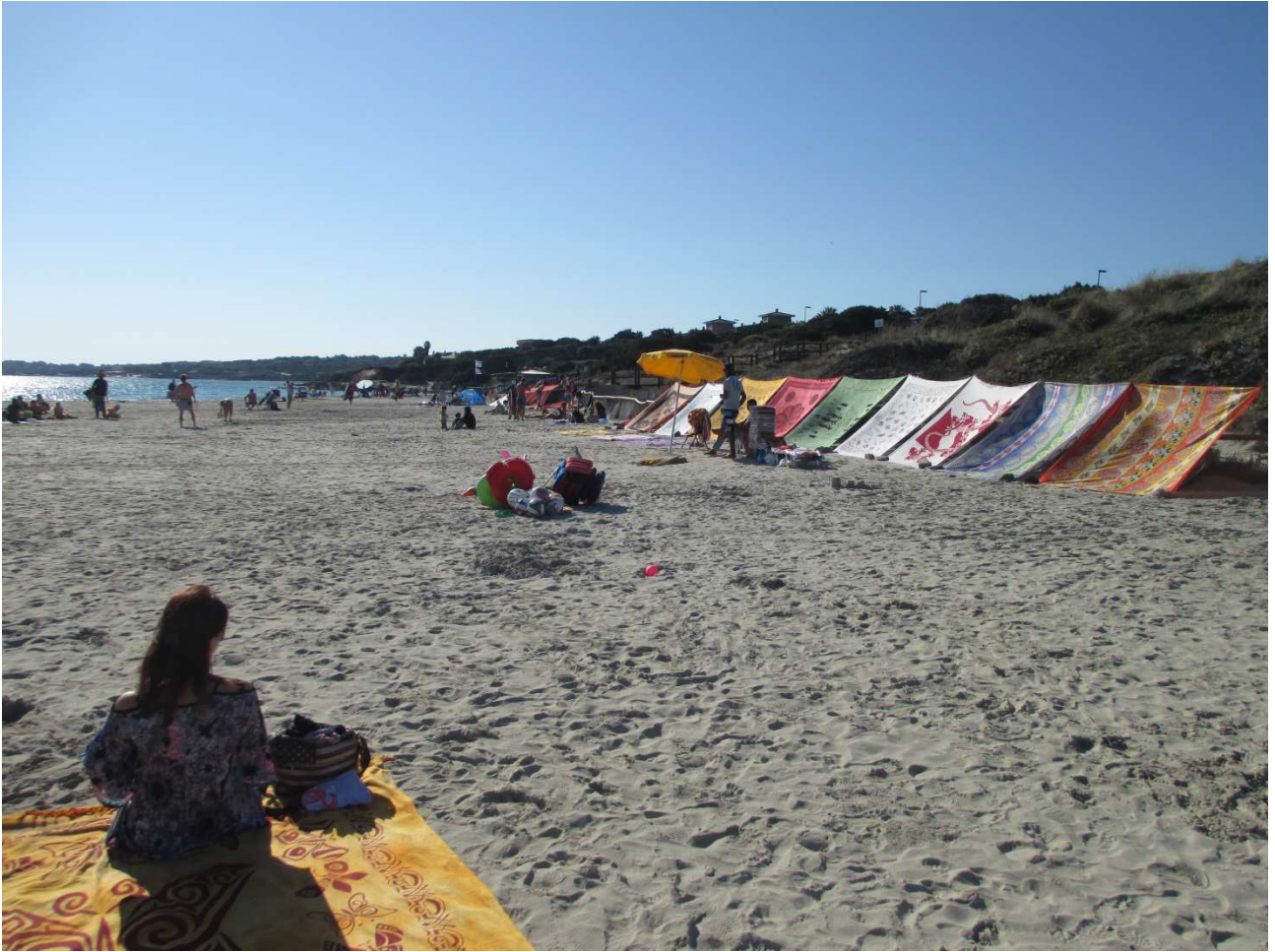
03/10/2015 Stintino ..... la pelosa e i suoi bagnanti