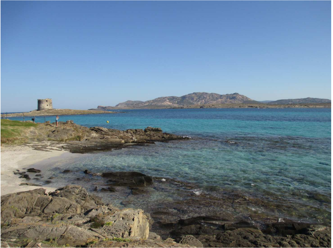
03/10/2015 Stintino ..... la pelosa e i sullo sfondo l'isola Asinara