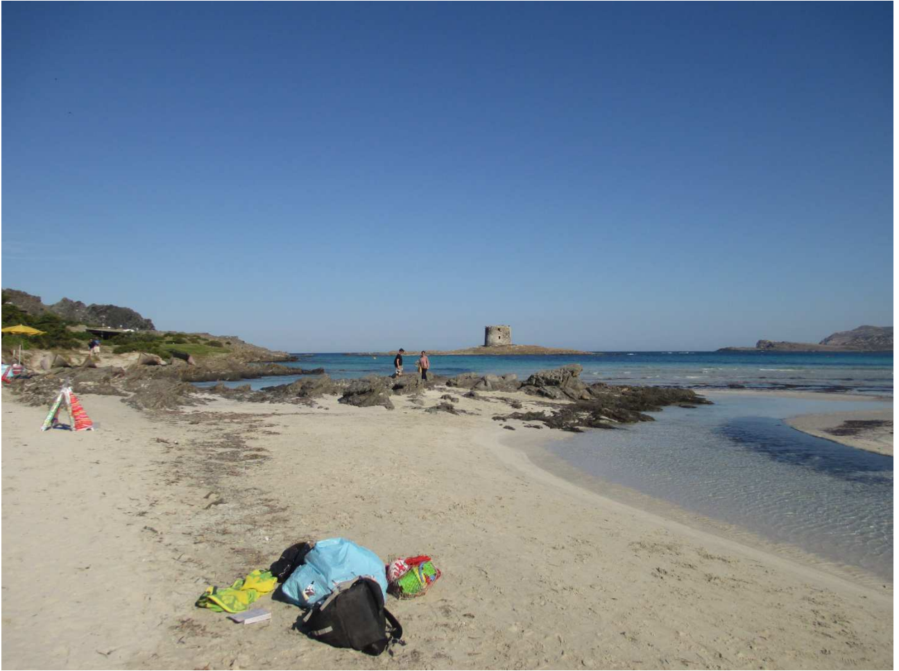
03/10/2015 Stintino ..... la pelosa e i suoi bagnanti