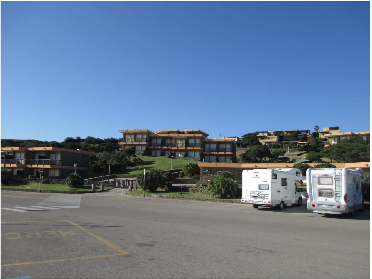
03/10/2015 Stintino ..... la pelosa e i suoi dintorni