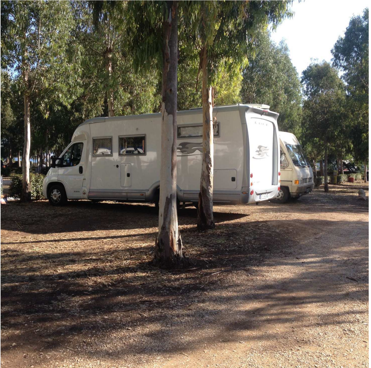
03/10/2015 Fertilia ..... nel campeggio "Laguna blu"