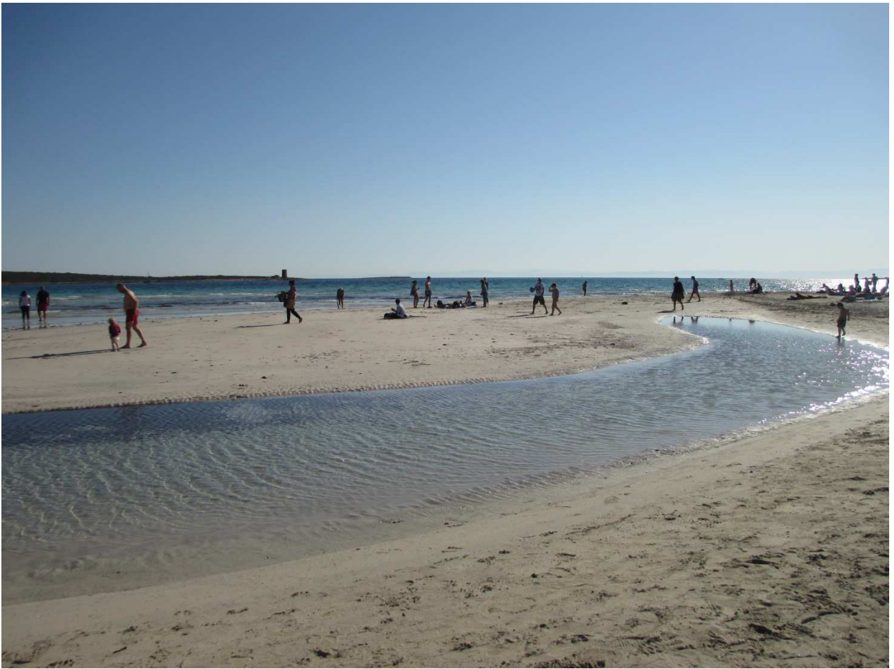
03/10/2015 Stintino ..... la pelosa e i suoi colori