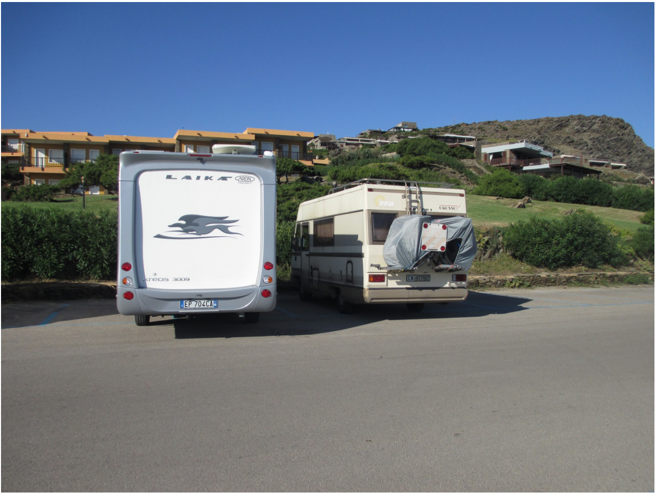
03/10/2015 Stintino ..... la pelosa e i nostri camper