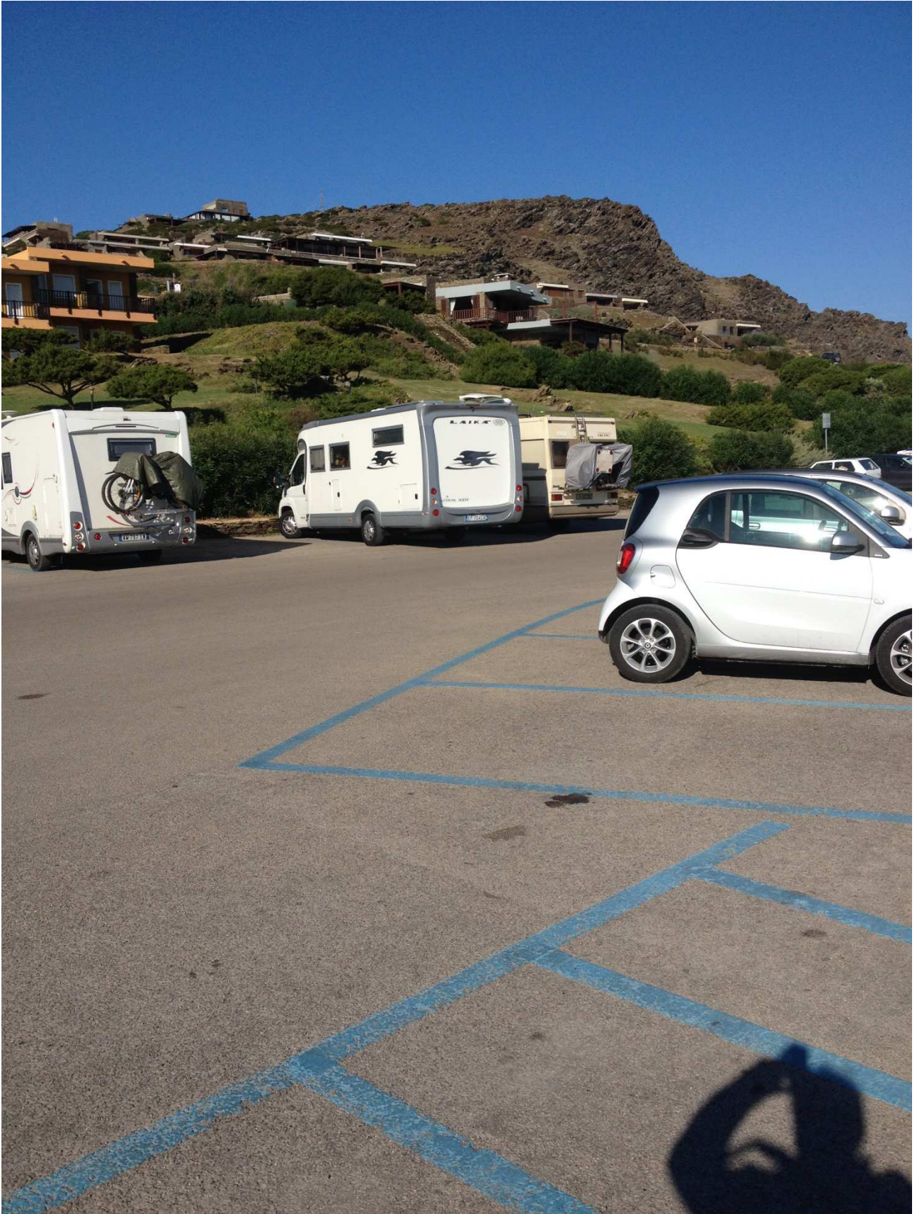
03/10/2015 Stintino ..... la pelosa e i suoi parcheggi